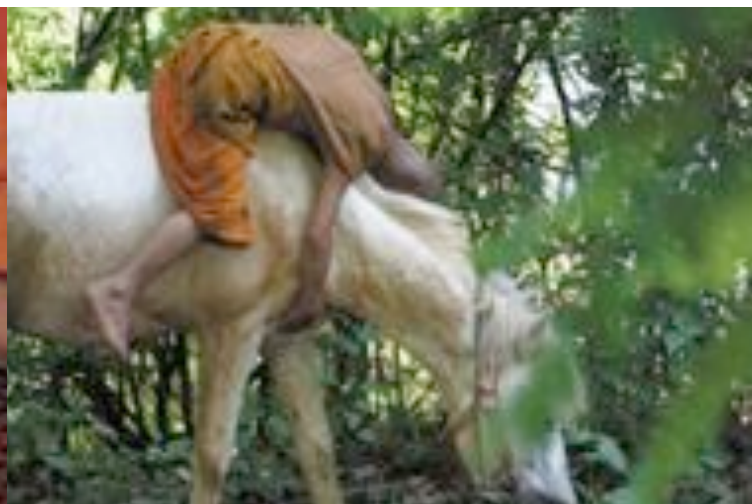
Bijschrift bij deze foto zclkksf sdk.