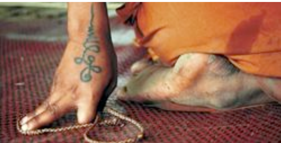
Bijschrift bij deze foto zclkksf sadssaSFafssfsdk.