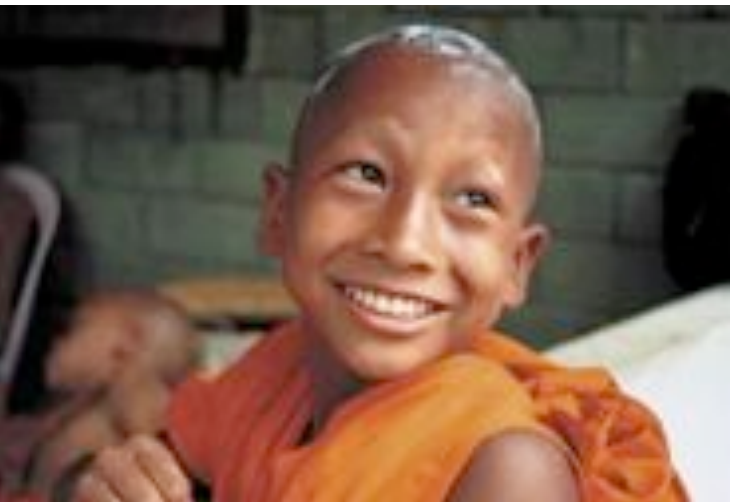
Bijschrift bij deze foto zclkksf sdk.