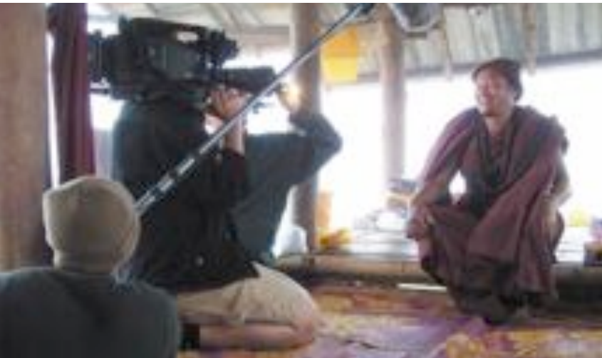
Bijschrift bij deze foto zclkksf sdk.