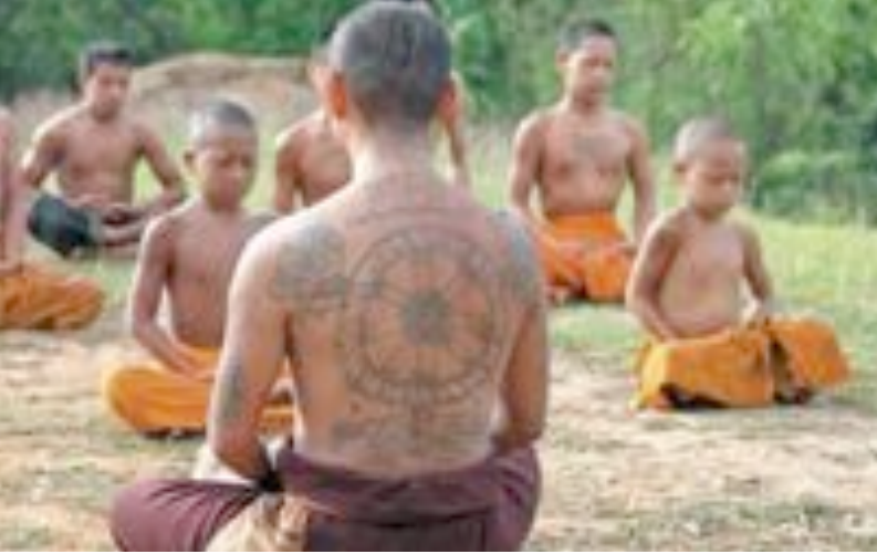
Bijschrift bij deze foto zclkksf sdk.