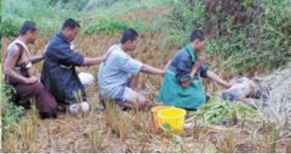
Bijschrift bij deze foto zclkksf sdk. Bijschrift bij deze.