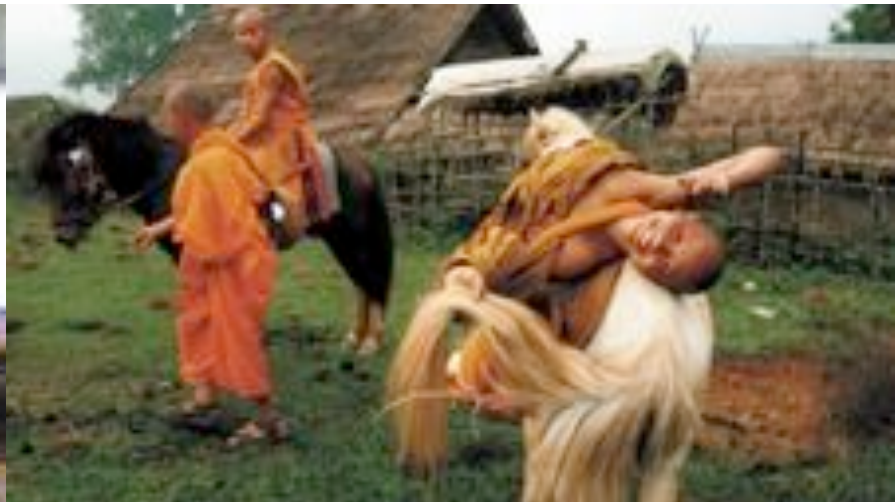
Bijschrift bij deze foto zclkksf sdk.